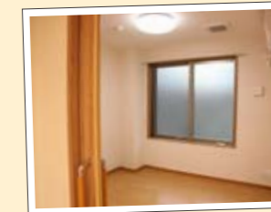
ご自宅での入浴・排泄・食事介助 その他の生活全般にわたる援助

【ご利用時間】ケアプランに沿って訪問する時間を決めさせていただきますが、必要に応じて随時訪問いたします。