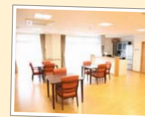
送迎・健康チェック・昼食 夕食（延長の方のみ）他