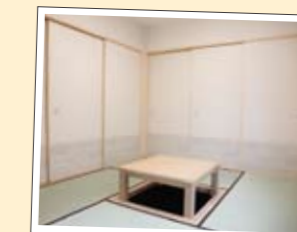
夜間お過ごしになるにあたっての 見守り・援助など